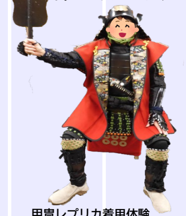
甲冑レプリカ着用体験

武士やお姫さまになってみよう 開館時間内であれば甲冑や着物を自由に着用できます。場所：真田宝物館内わくわくルーム 申込み不要、入館料のみ。